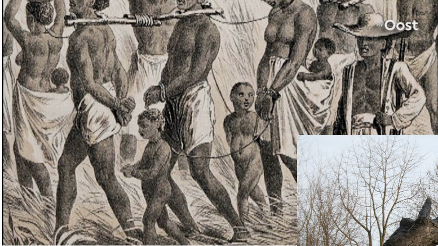
De slavernij in Oost en West: Het Amsterdam-onderzoek (2020)