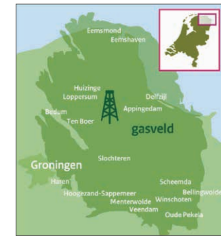
Het Groningenveld.